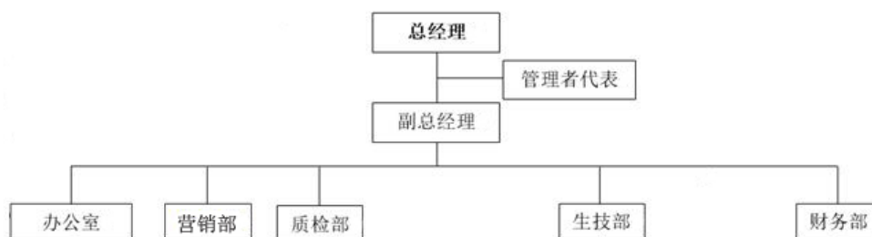
图：宁波东海组织机构示意图

公司按照管理体系和企业运行的要求，结合公司实际情况设置了各职能部门，其职能部门分别为办公室、营销部、质检部、生技部、财务部等，规定了各职能部门的职责权限和相互关系，分配了各自的质量职能。各部门各司其职、相互沟通配合，实现流畅、高效的运作。公司组织架构如下图所示：